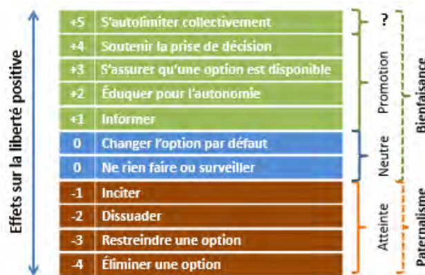
Figure 2 Évaluer les effets sur la liberté positive à l'aide de l'échelle de Griffiths et West (2015)

Sur la base de cette conception positive de la liberté, Griffiths et West proposent de classer autrement les interventions ciblées par le Nuffield Council on Bioethics (et en ajoutent trois autres). Ils placent au bas de leur échelle les interventions interférant avec la liberté, c'est-à-dire celles qui incitent, dissuadent, restreignent ou éliminent des options. Au centre de leur échelle, on retrouve des options qui n'auraient pas d'effets sur la liberté, soit l'absence d'intervention, la surveillance ou le remplacement d'une option par défaut par une autre. Enfin, ils situent en haut de l'échelle les interventions qui favoriseraient la liberté en informant, en éduquant pour l'autonomie, en s'assurant qu'une option est disponible, en soutenant la prise de décision ou celles qui résultent d'un effort collectif d'autolimitation. Nous reviendrons dans un instant sur cette dernière catégorie d'interventions.