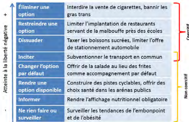
Figure 3 Départager les interventions coercitives des interventions non coercitives à l'aide de l'échelle d'intervention du Nuffield Council on Bioethics (2007)

coercitif s'il s'agit, par exemple, d'une subvention très importante.