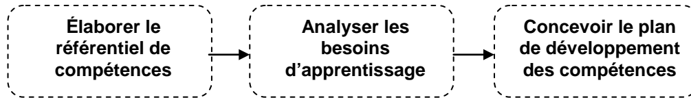
Figure 2 Du référentiel de compétences au plan de développement des compétences

Le référentiel de compétences est un outil qui permettra de concevoir un plan de développement des compétences en prévention et promotion de la santé comme le montre la figure 3. Concrètement, les informations du référentiel, principalement les ressources internes et externes, seront exploitées afin de réaliser des analyses de besoins d'apprentissage qui déboucheront vers des plans de formation.