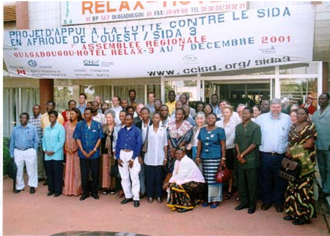
Équipe du Projet SIDA 3 lors de la 1 re assemblée régionale tenue en décembre 2001 à Ouagadougou au Burkina Faso