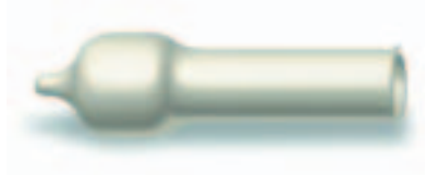
Photo 3. Condom avec embout très élargi

hommes, un condom plus petit sera plus confortable. Quoi qu'il en soit, l'anneau du condom doit être ajusté à la base du pénis pour bien tenir le condom en place.