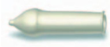
Photo 2. Condom avec embout élargi