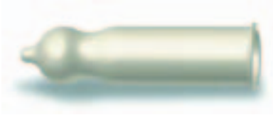
Photo 1. Condom galbé