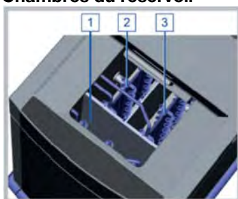
Figure 6 Chambres du réservoir