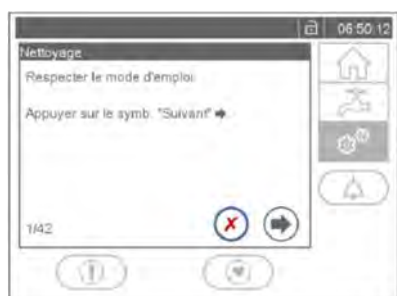
Figure 1 Unité de commande