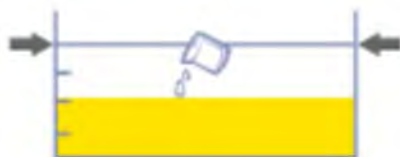
Figure 4 Niveau d'eau indiqué atteint le 2 e trait