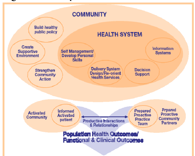
Figure 2 – L'« Expanded Chronic Care Model »