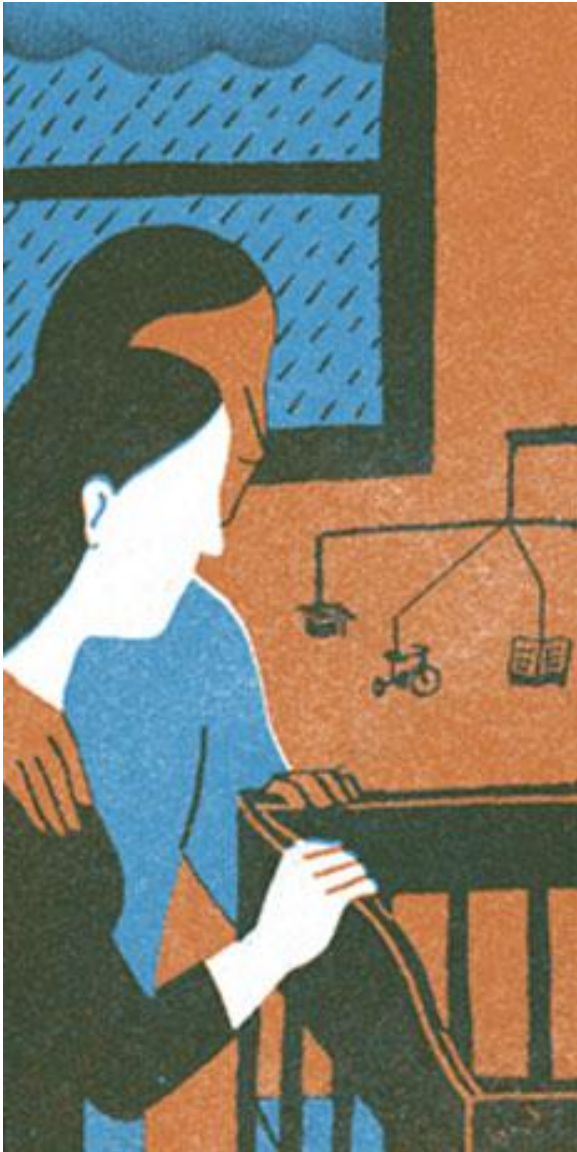
Illustration : Sophie Casson