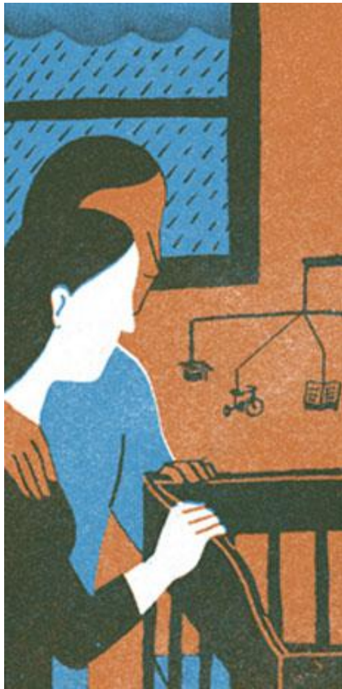
Illustration : Sophie Casson