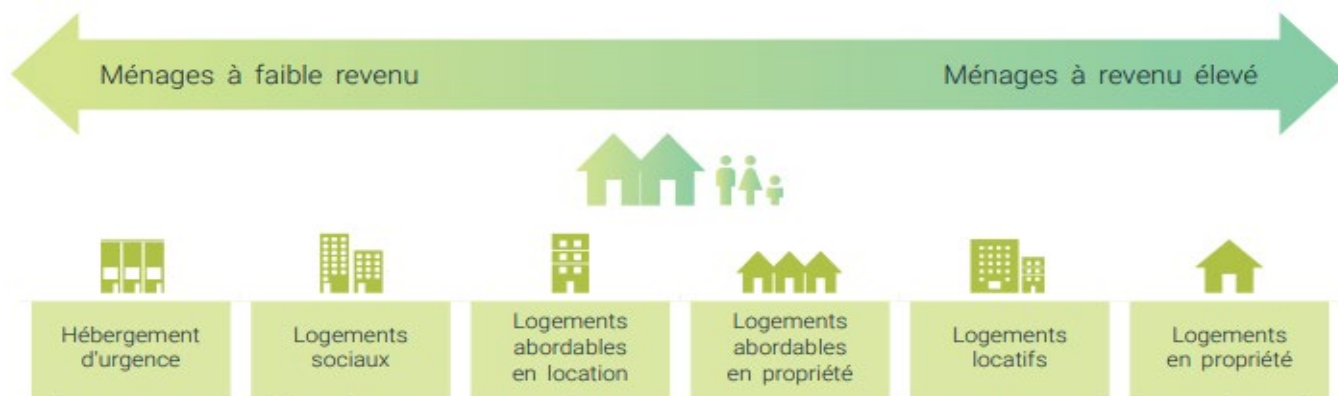
Figure 1 Le continuum de l'offre de logements