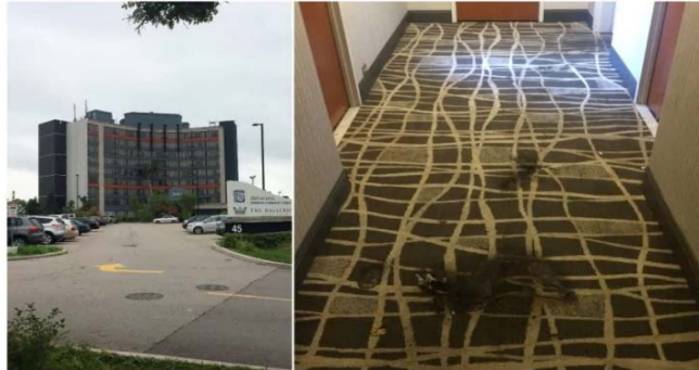
Scorch marks were left in the third-floor hallway of a Radisson hotel in east Toronto (left) after a gas can was set alight there on Tuesday, Oct. 2, 2018.

CBC Radio - Posted: Oct 11, 2018 8:00 AM ET | Last Updated: October 11, 2018