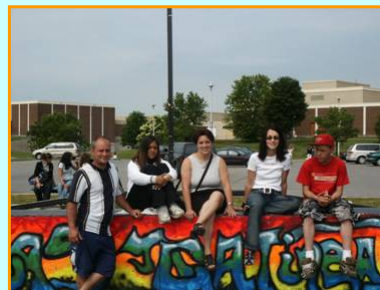
Décoration parc de planche Nicolas-Gatineau