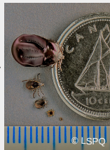
Photo : Ixodes scapularis aux stades nymphe, adulte mâle, adulte femelle et femelle engorgée de sang.