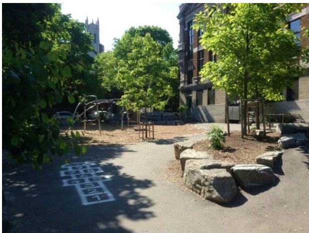
Figure 2 Aménagement de zones ombragées