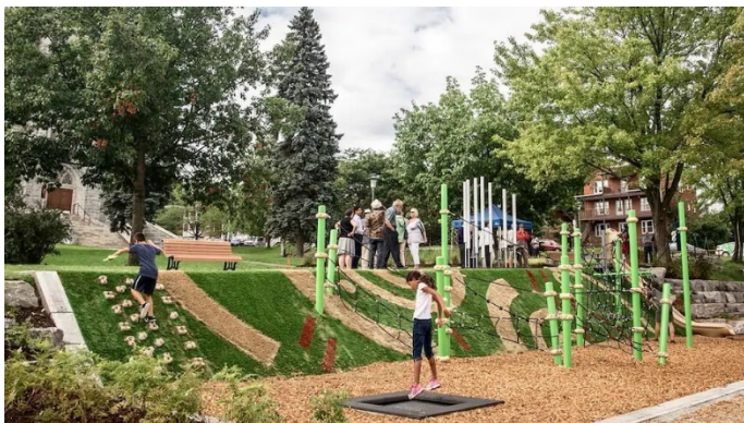
Figure 3 Aménagement favorisant le jeu libre