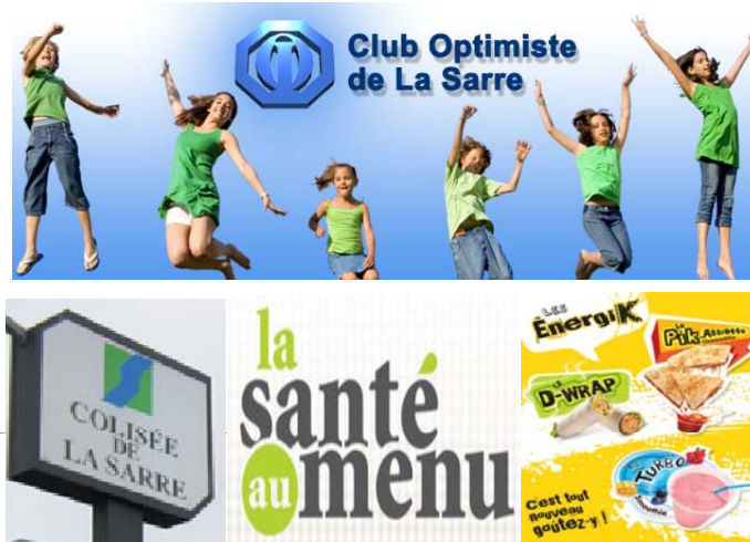
Le programme "La santé au menu" débarque dans les casse-croûtes d'aréna